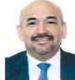
Dip. Jorge Arturo Espadas Galván PAN